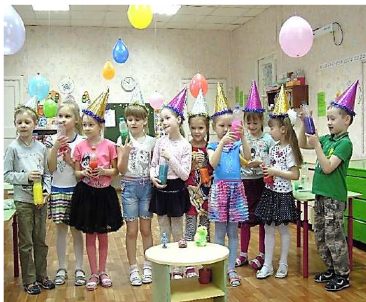
Ура! Все загадки разгаданы!

Сегодня победила сила команды, единство, взаимопомощь, талант каждого игрока, а всё вместе это, конечно, Дружба! Звездочет.