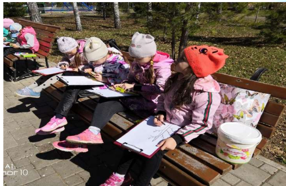
Рисование деревьев в Скарятинском саду