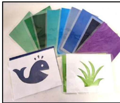
«Подбери нужный цвет»