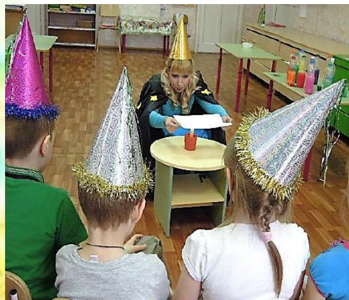
Прочтение тайного письма